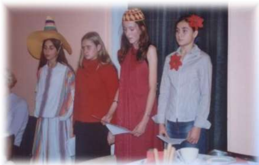
Występ grupy młodszej młodzieży: Zwyczajne święteczne na świecicie