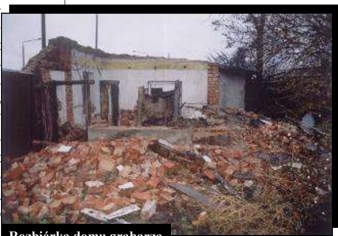
Rozbiórka domu grabarza

W tym miejscu pragniemy wszystkim ofiarodawcą jeszcze raz gorąco podziękować za pamięć i wsparcie.