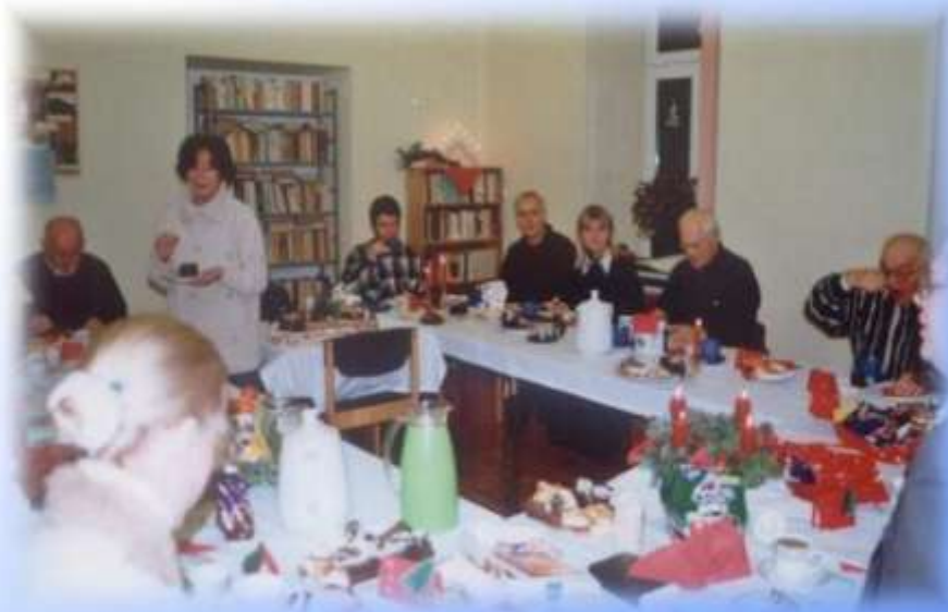
Wieczór adwentowy w Kielecach